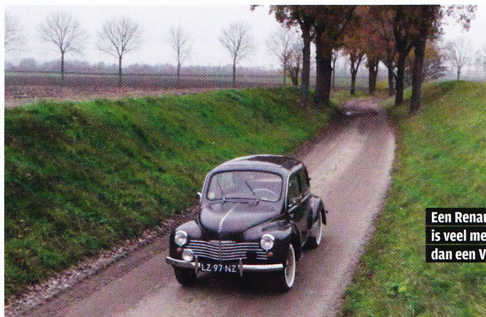
Een Renault 4CV is veel meer auto dan een Vespa 400.